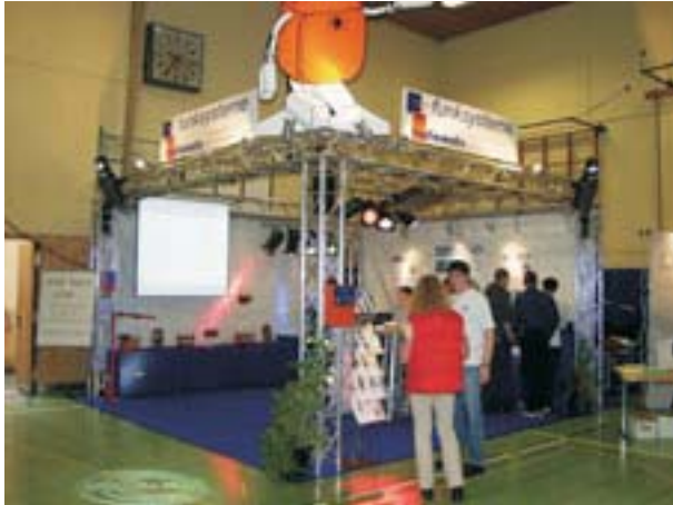
oben links: HBC Messestand mitte links: Modeschau (Open Air) mit Traversenkonstruktion oben rechts: Shot a duck (Coverband Bühnenaufbau)