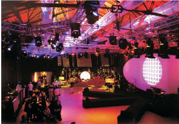
oben links: family day mitte links: Firmenfeier Pepsi oben rechts: Weinmesse Pro Wein