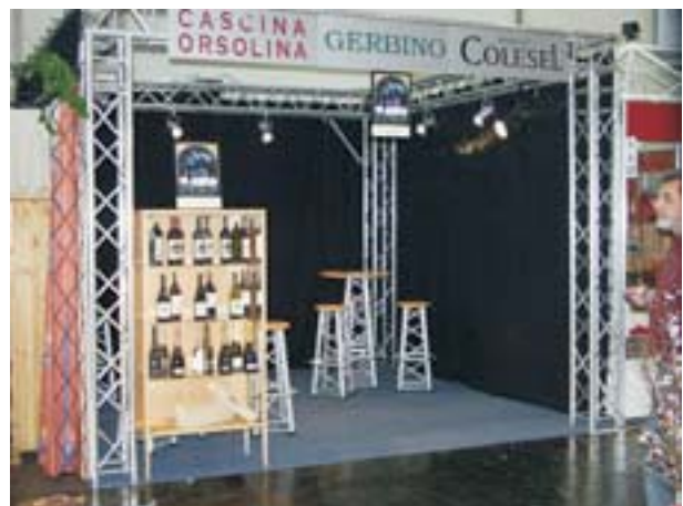
unten rechts: Pro Wein unten links: Silvestergala -wenn keine störenden Stützen den Stand begrenzen sollen , kann die gesamte Konstruktion auch "geflogen" werden , dabei wird der Aufbau mittels Hand / Motorkettenzügen auf die gewünschte Höhe gezogen + gesichert.